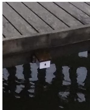
UP1 monterad på brygga